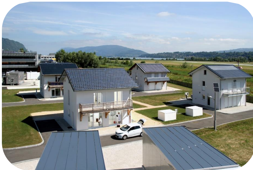
Expérimentations SEREINE maisons tests

Quelle est la performance énergétique réelle de son logement ? Aujourd'hui, cette question est au centre des préoccupations de tous les propriétaires, que ce soit au moment de l'achat d'une maison, ou à l'occasion de travaux importants de rénovation. Depuis 2019, les chercheurs de SEREINE, projet d'innovation du programme PROFEEL porté par la filière de la construction, travaillent à l'élaboration d'un outil inédit de mesure de l'efficacité énergétique des bâtiments. Après une 1 re phase d'expérimentation concluante, SEREINE lance aujourd'hui une nouvelle campagne de tests, afin d'optimiser sa solution innovante et fiable de mesure de performance. 240 propriétaires de maisons individuelles sont invités à y participer, dans toute la France, d'ici fin 2024. À cette occasion, les particuliers intéressés bénéficieront d'une évaluation gratuite de la performance énergétique de leur logement. C'est le moment ou jamais d'en profiter, pour se rassurer sur ses consommations énergétiques ou bien évaluer le niveau réel de performance énergétique de son logement !