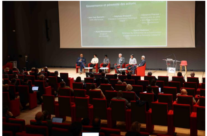
Matinée de restitution

A l'occasion des Assises de la Construction Durable en Outre-mer, une quarantaine de rapporteurs, ministres et représentants des territoires ultramarins et représentants des instances nationales, se sont réunis le 20 février pour la matinée de restitution publique des ateliers conclusifs. S'inscrivant dans le cadre du programme OMBREE, l'organisation de ces Assises était l'une des préconisations du rapport sénatorial de 2017. La dernière étape sera la publication d'un livre blanc en octobre 2024, afin de proposer des référentiels adaptés aux spécificités de ces territoires. Tour d'horizon des premières conclusions de cette mobilisation sans précédent des acteurs ultramarins.