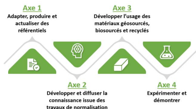
Articulation des propositions de l'atelier 'Adaptation et production de référentiels techniques'