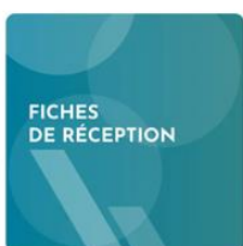
Fiches de réception