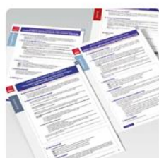
Attestations d'essais de fonctionnement