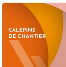
Calepins de Chantier