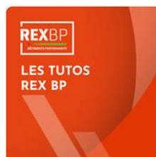
Tutos du Rex Bâtiments Performants