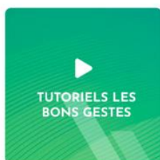
Tutoriels Les bons gestes